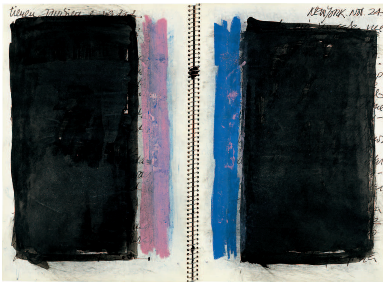
DOBLE PÁGINA DEL DIARIO II

Jordi Teixidor is not naïve and he knows that it is an illusion to think that