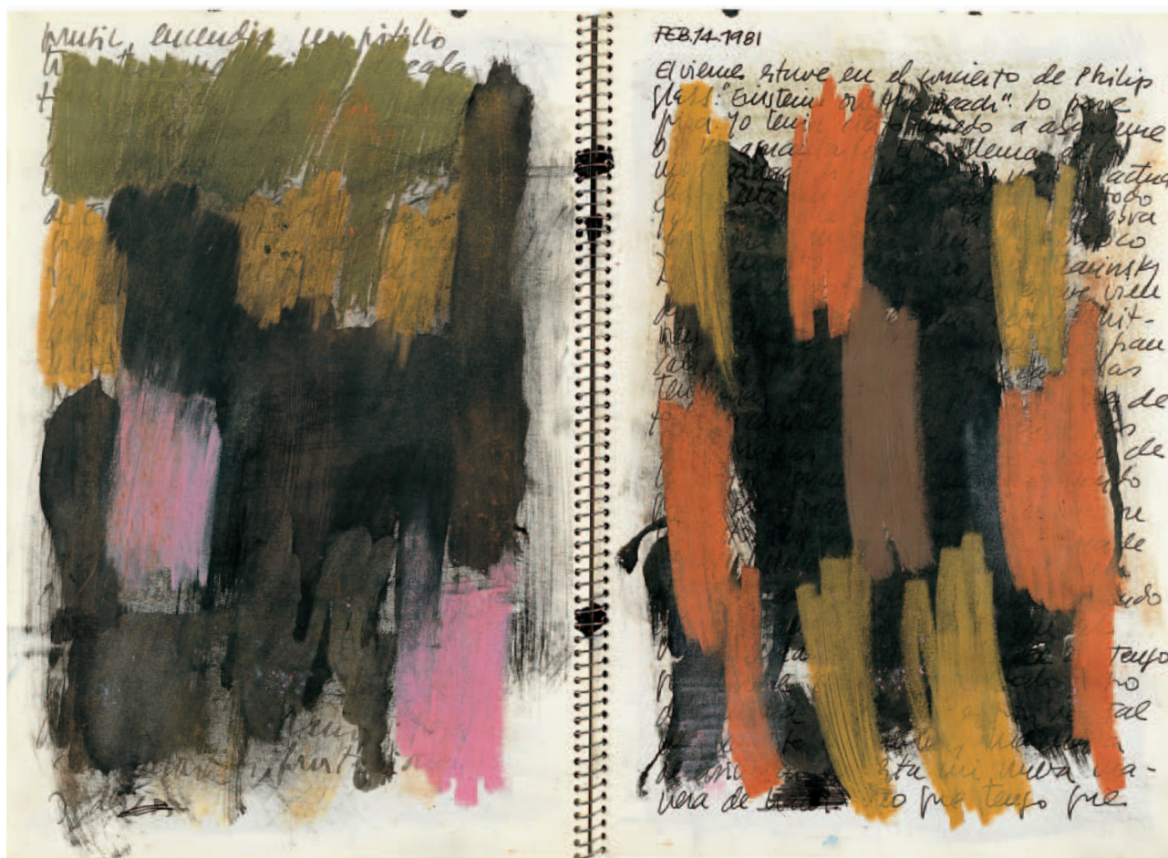
DOBLE PÁGINA DEL DIARIO II

ción moderna: hay que definir cuál es el modus de vida y de pensamiento que fracasa cuando fracasa la pintura abstracta.